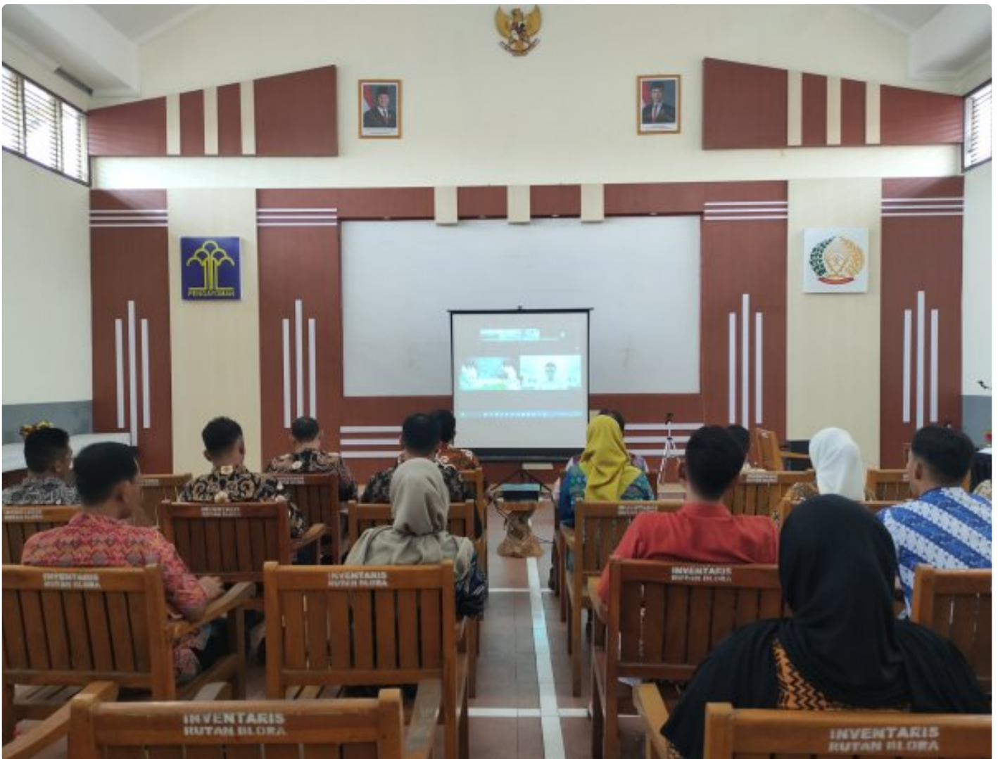
ASN Rutan blora ikuti pengrahan menteri kemenimipas

Blora - Rumah Tahanan Negara (Rutan) Kelas IIB Blora melaksanakan kegiatan pengarahan yang disampaikan langsung oleh Menteri Imigrasi dan Pemasarakatan, Agus Andrianto. Kegiatan ini diikuti oleh seluruh ASN di